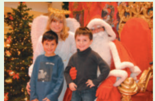
Der Nikolaus wird am Dienstag, dem 6. Dezember, von 14 bis 19 Uhr ins Isenburg-Zentrum kommen.

Damit für den vorweihnachtlichen Einkaufsbummel auch genug Zeit bleibt, haben die jetzt 140 Fachgeschäfte des neuen Isenburg-Zentrums an allen Adventssamstagen bis 22 Uhr geöffnet. Wem das noch nicht reicht, der kann außerdem an Heiligabend sowie an Silvester von 9 bis 14 Uhr ins Center kommen, um die letzten Einkäufe zu erledigen.