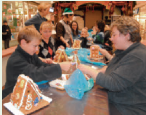
Die Weihnachtsbackstube des Cafés Ernst ist bis einschließlich 23. Dezember jeweils montags bis freitags von 14 bis 17 Uhr für alle Centerbesucher geöffnet.

Wahrlich märchenhaft geht es in den Wochen vor Weihnachten im Isenburg-Zentrum zu. Denn die herrliche Dekoration im Center steht in diesem Jahr unter dem Motto „Märchenhafte Weihnachten“. In liebevoll gestalteten Szenarien werden die beliebtesten Märchen wie Hänsel und Gretel, Dornröschen, Rotkäppchen oder Der gestiefelte Kater mit vielen beweglichen Figuren dargestellt – ein Erlebnis sicher nicht nur für die jungen Centerbesucher.